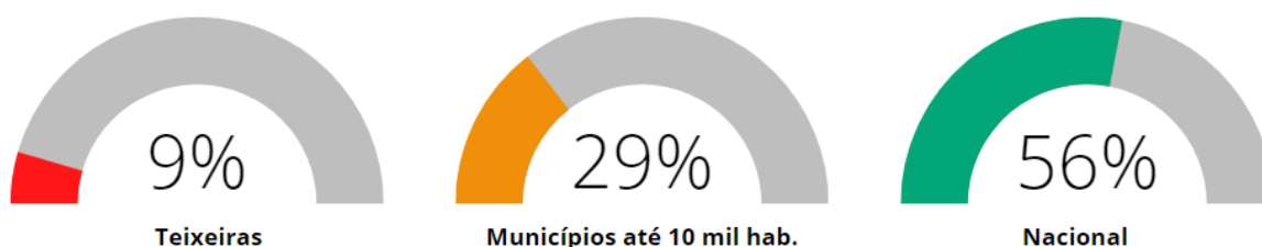
Gráfico 2: Indicador de autossuficiência financeira e médias nacional e municípios com até 30 mil hab.